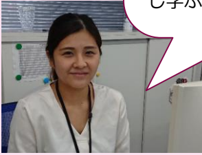
◀2021年5月入社 リサイクル事業部 所属

子どもが小さい内は、正社員としてフルタイム勤務は無理だろうと思っていましたが、『短時間正社員制度』を利用することで、子育てと仕事の両立ができました。母として社会人として、たくさん経験し学ぶ時間がとれています。