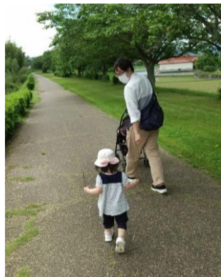
中特グループホームページ イクメン日記より▶