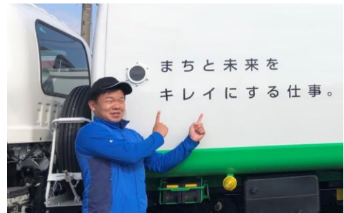
▲中型免許を取得し活躍中の社員