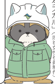
「日進工業株式会社キャラクター「タスカル」」（同社女性社員制作）