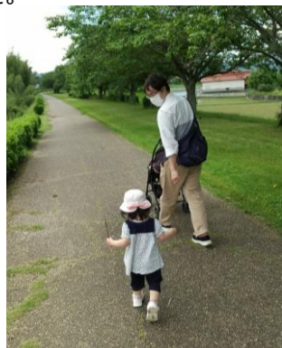
中特グループホームページ イクメン日記より▶