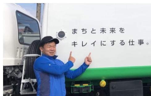
▲中型免許を取得し活躍中の社員