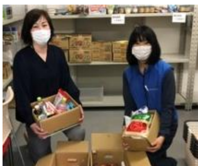
フードバンク山口へ 寄贈いただいた 食品の数々▶

・仕事と家庭の両立がしやすい企業イメージが浸透し、事務職・現場職など職種に関わらず有能な女性の採用が実現した。