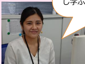
◀2021年5月入社 リサイクル事業部 所属

子どもが小さい内は、正社員としてフルタイム勤務は無理だろうと思っていましたが、『短時間正社員制度』を利用することで、子育てと仕事の両立ができました。母として社会人として、たくさん経験し学ぶ時間がとれています。